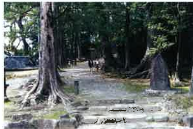
竹田神社いにしへの道