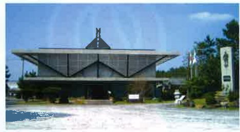
万世特攻平和祈念館